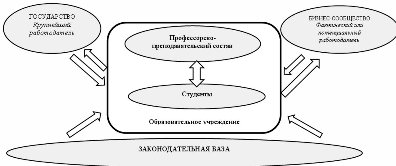
Рисунок 1. Общая схема работы СКП (разработано авторами).

В качестве третьего структурного элемента, следует рассмотреть законодательную базу, на которую опирается общество при оценке эффективности системы подготовки кадров для сферы услуг и уровня формирования профессиональной готовности специалистов к инновационному проектированию в сервисной деятельности.