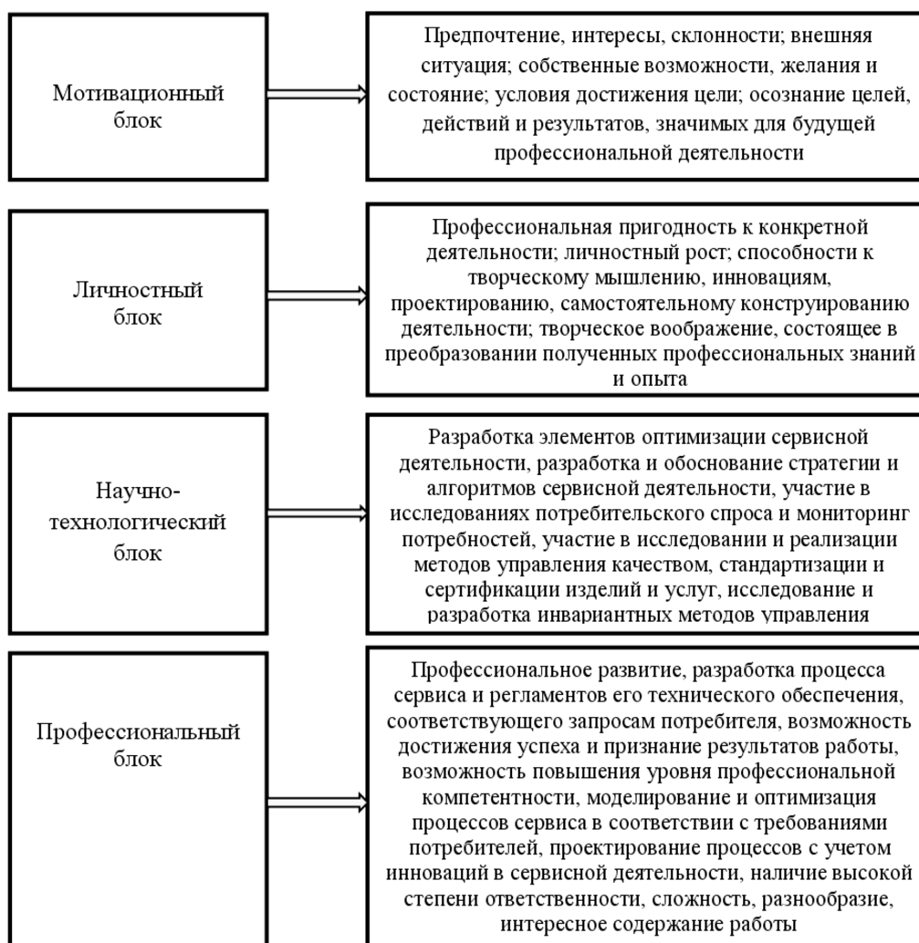
Рисунок 4. Основные этапы формирования профессиональной готовности специалистов к инновационному проектированию в сервисной деятельности.