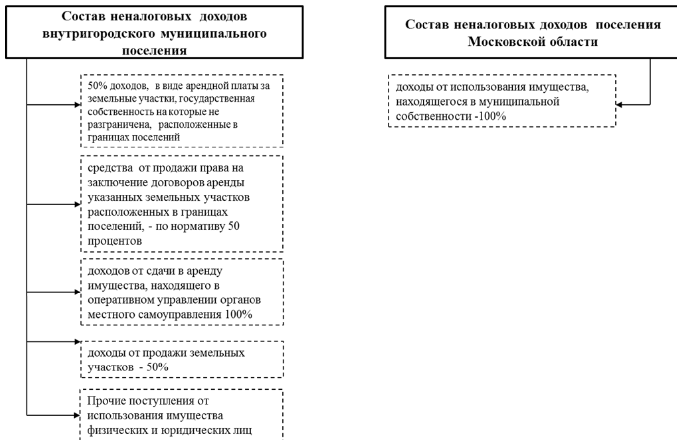
Рис. 2. Состав неналоговых доходов внутригородских муниципальных образований и поселений Московской области

позволяет сделать вывод, что они имеют гораздо больше возможностей по своему усмотрению использовать средства на благоустройство и другие нужды поселений, чем аналогичные образования в области.