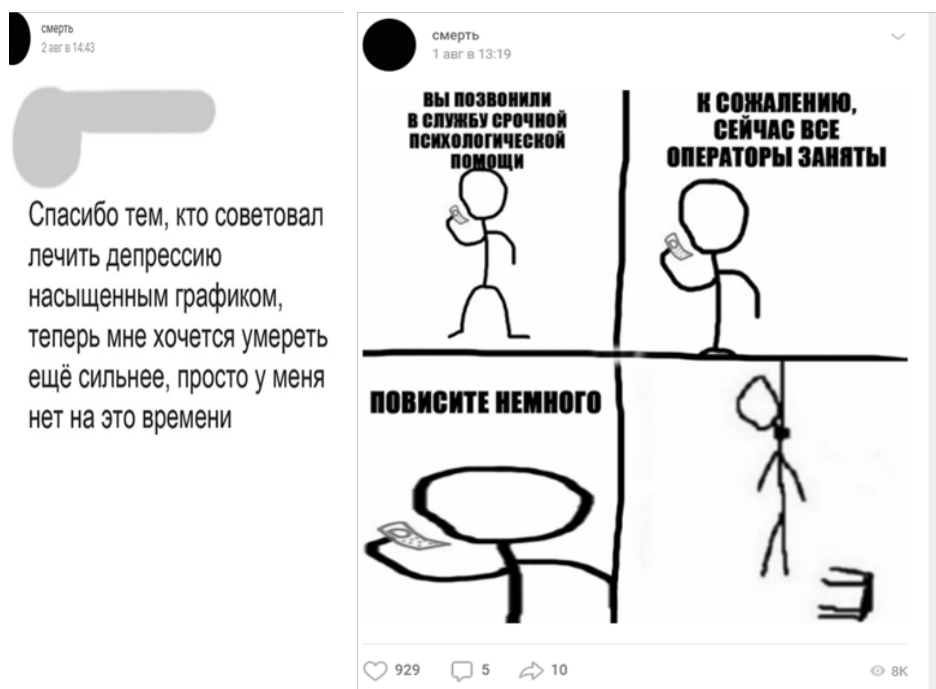
Рис. 3. Ценности группы