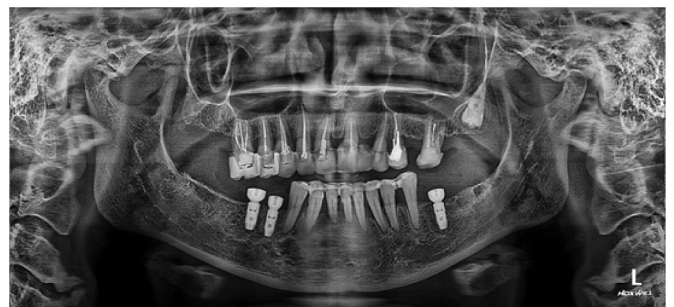
Рис. 4. Ортопантомограмма пациентки М. в 2020 г. с шиной 44–34 и временными пластмассовыми коронками 16–24, имплантаты в позиции 46,45,35