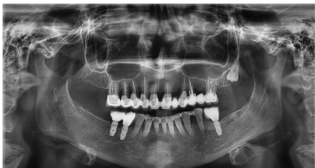
Рис. 6. Ортопантомограмма пациентки М. после лечения 2023 г.