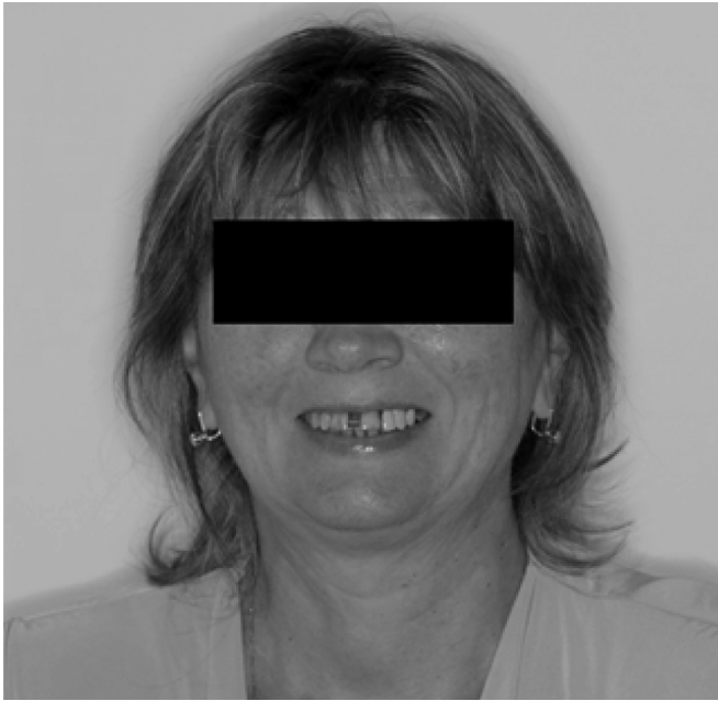
Рис. 1. Фотография пациентки М., 51 год, после снятия брекет-системы