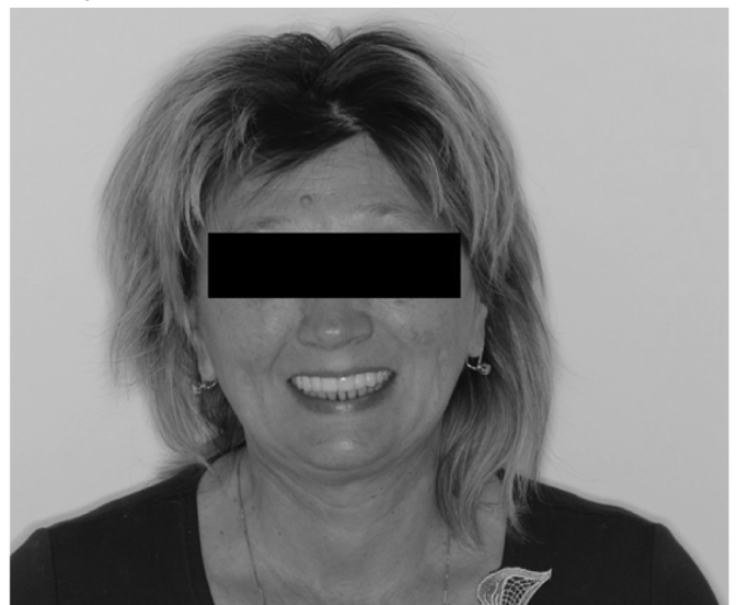
Рис. 5. Фотография пациентки М. после завершения лечения