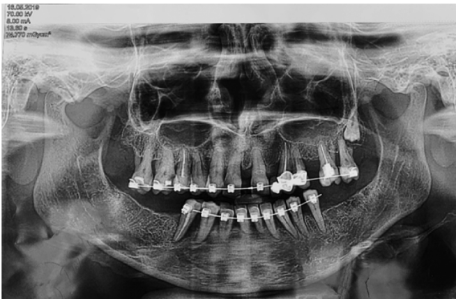
Рис. 2. Ортопантомограмма пациентки М. на этапе ортодонтического лечения 2019 г.

В 2019 г. проведено шинирование 44–34 зубов на нижней челюсти. Были удалены зубы 17,27,45. На верхней челюсти эндодонтически пролечены зубы 16,15,13,12,11,21,23,24,26. Изготовлен временный пластмассовый мостовидный протез 16–26, который был заменен на металло-керамический мостовидный протез 16–26. Установлены имплантаты в позициях 46,45,35 и установлены коронки на имплантатах. Был использован погружной метод шинирования с использованием материала Dentareg с созданием бороздки на язычной поверхности в связи с выраженной резорбцией костной ткани (рис. 3).