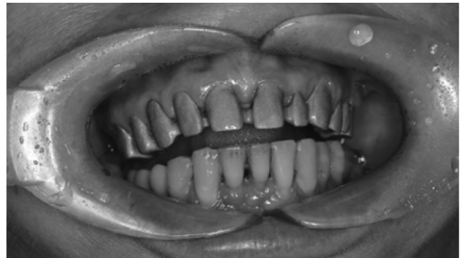
Рис. 3. Фотография пациентки М. на этапе проверки каркаса мостовидного протеза 16–26 на верхней челюсти, на нижней челюсти шина 44–34

межзубных промежутков, что наиболее ярко выражено в области нижней челюсти (рис. 4). Зубы устойчивы, восстановление функции жевания в боковых участках и жесткая конструкция на верхней челюсти обеспечили адекватное распределение нагрузки на пародонт зубов. Улыбка пациентки демонстрирует высокую степень удовлетворенности результатом комплексного лечения (рис. 5). Ортопантомограмма пациентки М. после лечения в 2023 году.