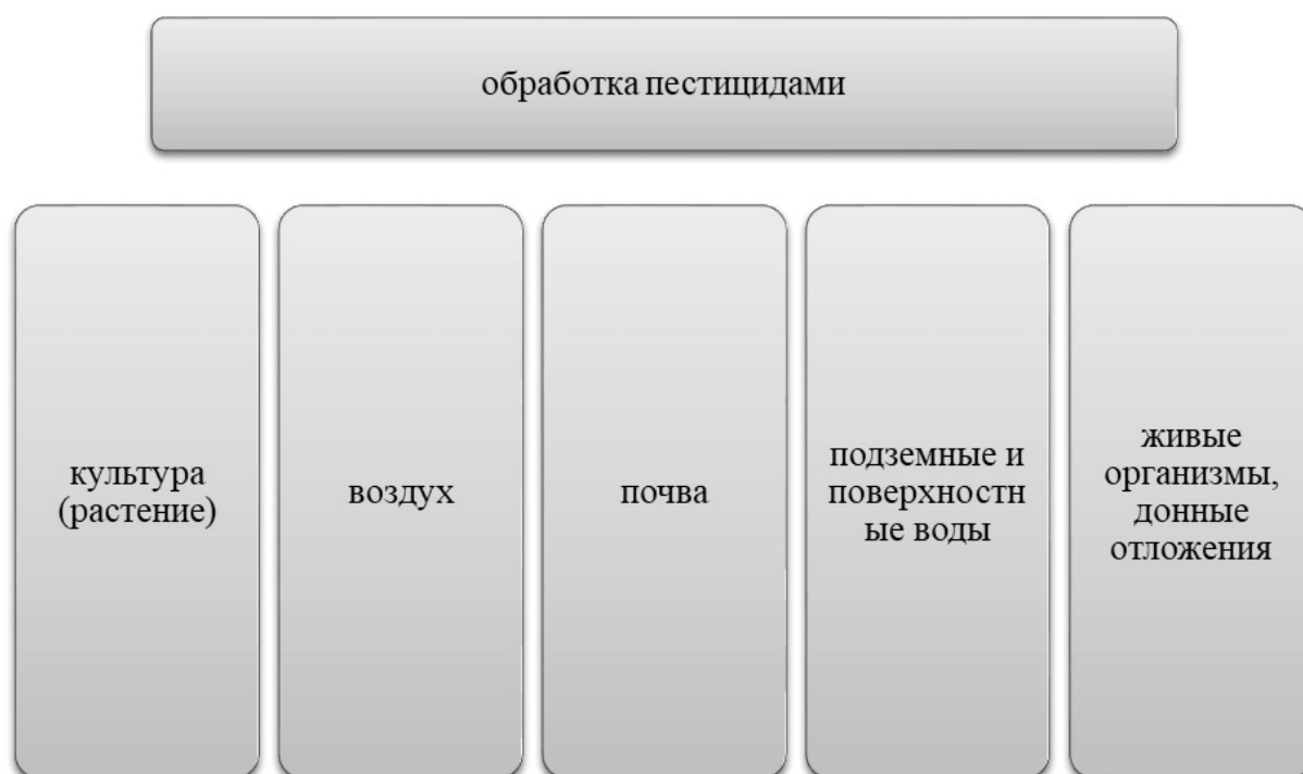
Рис. 1. Циркуляция пестицидов во внешней среде

В большинстве случаев пестициды попадают в воду при неправильной технологии опрыскивания растений, в результате вымывания из почвы, с талыми и дождевыми водами при смыве с почвенного покрова и растений.