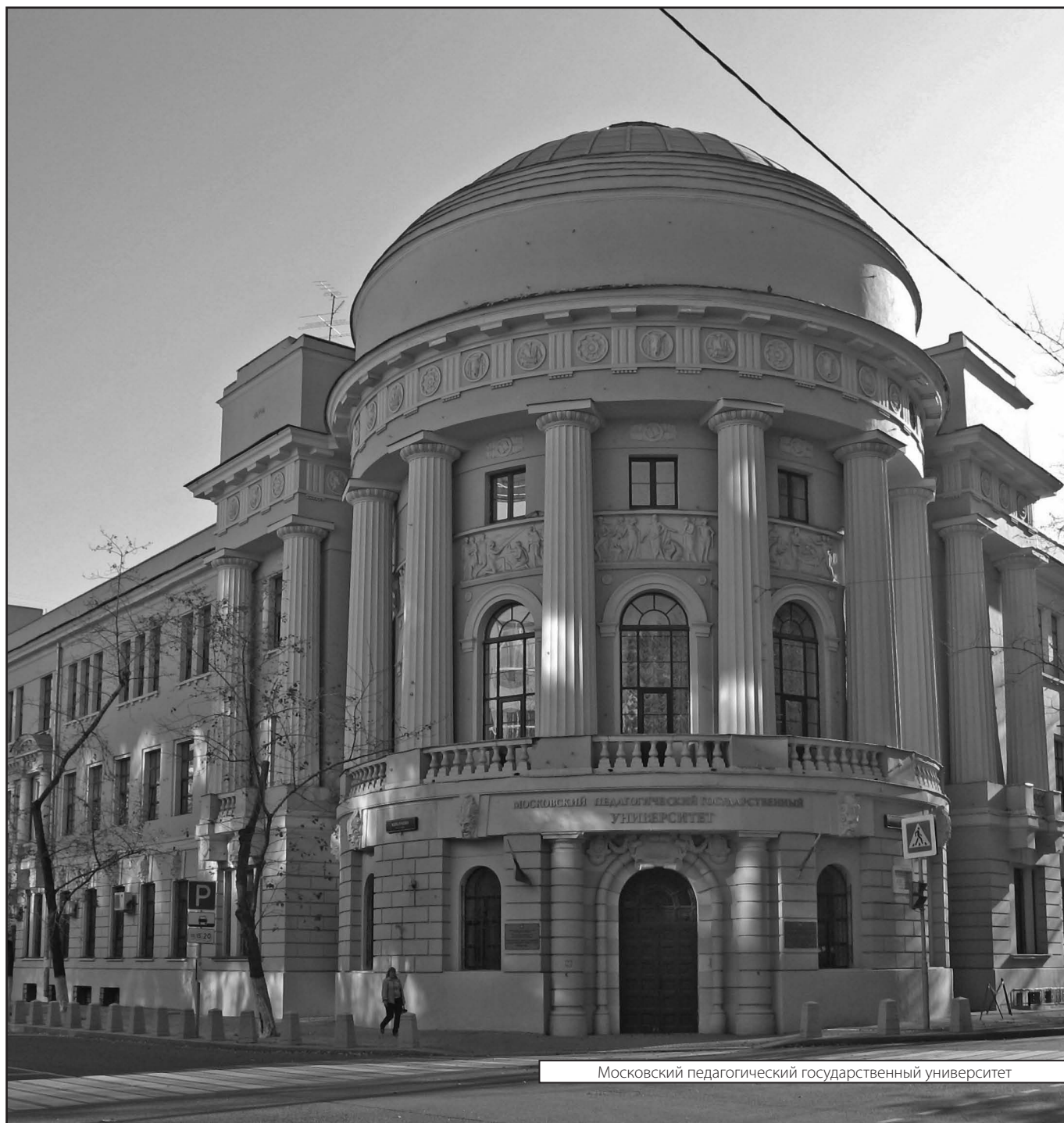
Московский педагогический государственный университет

Журнал «Современная наука: актуальные проблемы теории и практики»