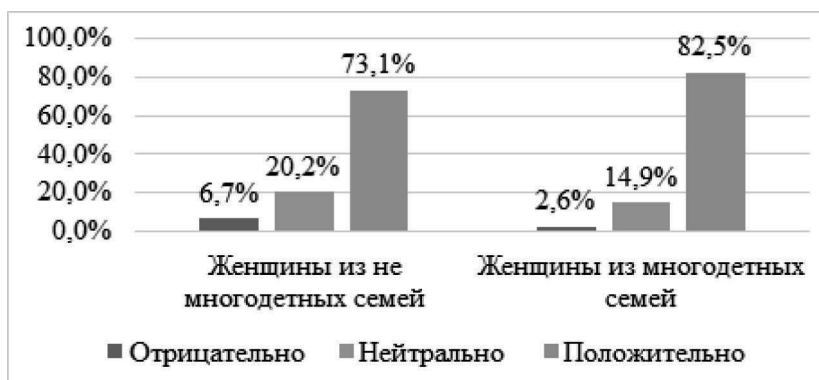
Рис. 2. Распределение ответов на вопрос «Как вы оцениваете свои отношения с родителями?»