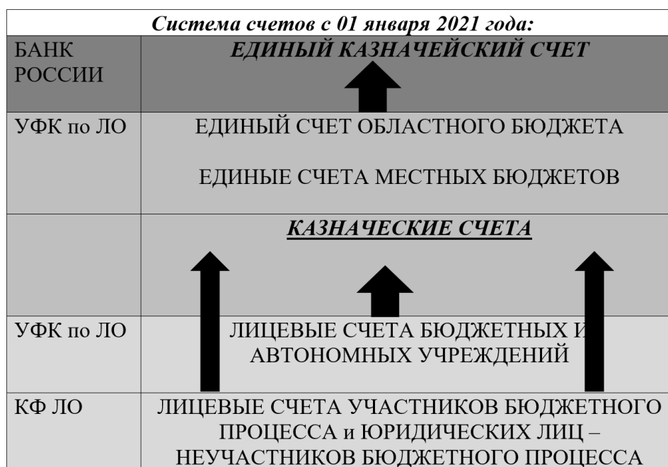
Рис. 1. Схема системы казначейских счетов на примере Ленинградской области

в СКП операций участников СКП с денежными средствами и их отражение на соответствующих казначейских счетах. Казначейское обслуживание исполнения бюджетов бюджетной системы РФ осуществляет Федеральное казначейство (ТОФК).