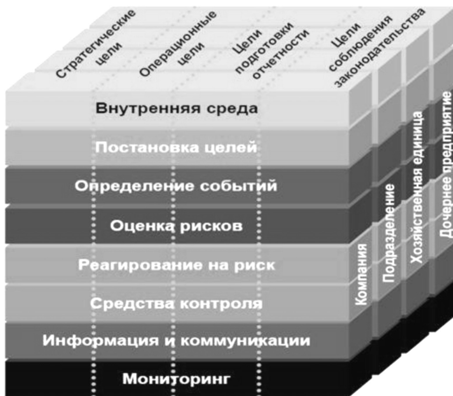
Рисунок 3. Матричный куб учетно-аналитического обеспечения риск-менеджмента устойчивого развития сельскохозяйственных предприятий.

Матричный куб учетно-аналитического обеспечения риск-менеджмента устойчивого развития сельскохозяйственных предприятий складывается из трех основных граней. Фронтальная сторона визуализирует основные приемы риск-менеджмента с корректировкой целей устойчивого развития в режиме реального времени в зависимости от просмотра точечных операционных целей каждой из его составляющих. Верхняя грань характеризуется различным набором целей устойчивого развития. Траекторные экономические цели характеризуются, например, увеличением прибыли предприятия, а операционно-тактические цели социального обеспечения – повышение производительности труда и мотивированной заработной платы, повышение квалификации работни-