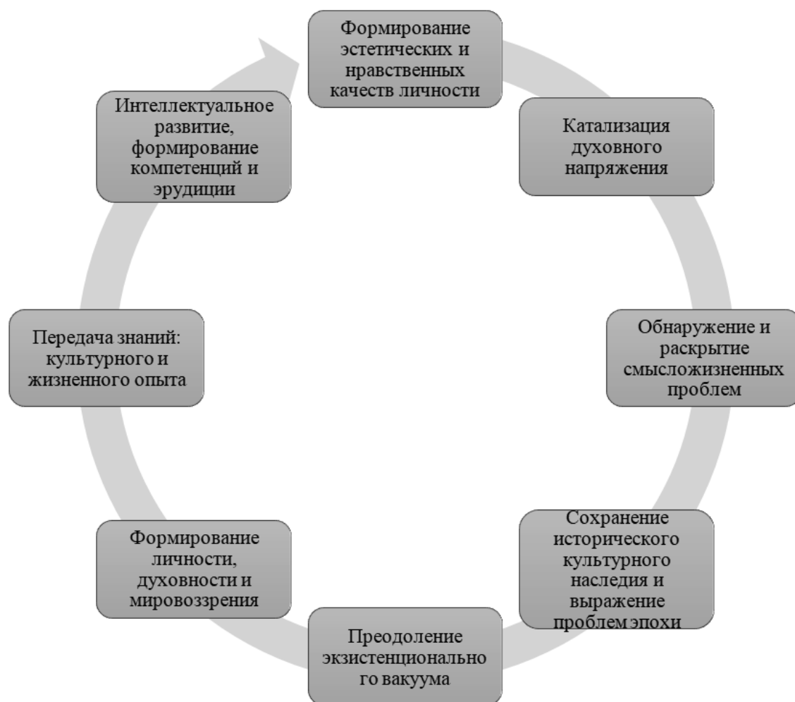
Рис. 2. Воздействие музыки на духовное становление в контексте исторического развития общества

Исходя из результатов исследований С. Муртонен (Murtonen 2018), музыка содействует духовному развитию молодежи, в том числе, формированию ее субъективного мировоззрения, коррелирующего с ее текущими жизненными проблемами, и выступает как механизм решения задач, связанных с духовным благополучием – по мнению С. Муртонен песни и мелодии «для души» от-