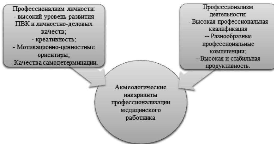
Рис. 3. Взаимосвязь профессионализма личности и профессионализма деятельности