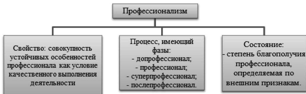
Рис. 2. Подходы к рассмотрению профессионализма

ных феноменов рассмотрим суть профессионализма (рисунок 2).