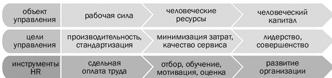
Рис.2. Современные цели и инструменты управления персоналом

Заемный труд – предоставление работников нанятых частным кадровым агентством в распоряжение третьей стороны. Сегодня существуют следующие формы заемного труда: