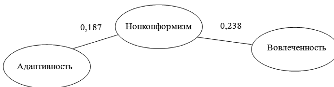
Рис. 4. Корреляционная плеяда между нонконформизмом и параметрами у женщин в чрезвычайных и экстренных ситуациях.

Корреляционная плеяда по данному анализу представлена на рисунке 4. При этом у мужчин не было обнаружено связей в чрезвычайных и экстренных ситуациях.