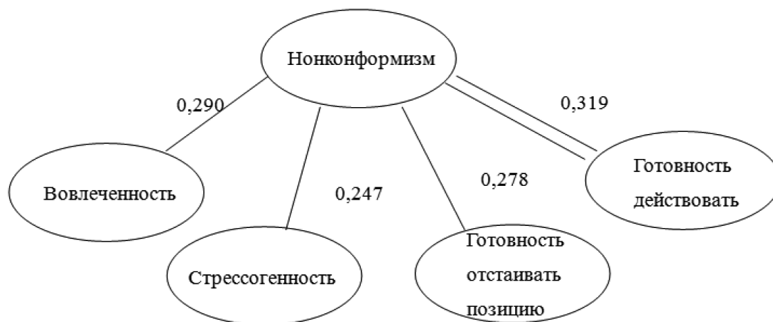
Рис. 5. Корреляционная плеяда между нонконформизмом и параметрами поколения Z в чрезвычайных и экстренных ситуациях.

позицию были обнаружены у представителей поколения Z. Также нонконформизм определяет адаптивность и вовлеченность у женщин в чрезвычайных и экстренных ситуациях. У поколения Z в аналогичных ситуациях нонконформизм связан с вовлеченностью, стрессогенностью, готовностью действовать и готовностью отстаивать свою позицию.