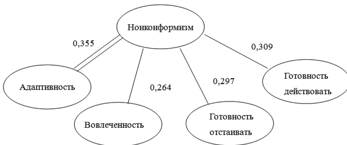
Рис. 3. Корреляционная плеяда между нонконформизмом и параметрами у поколения Z в обыденных ситуациях.