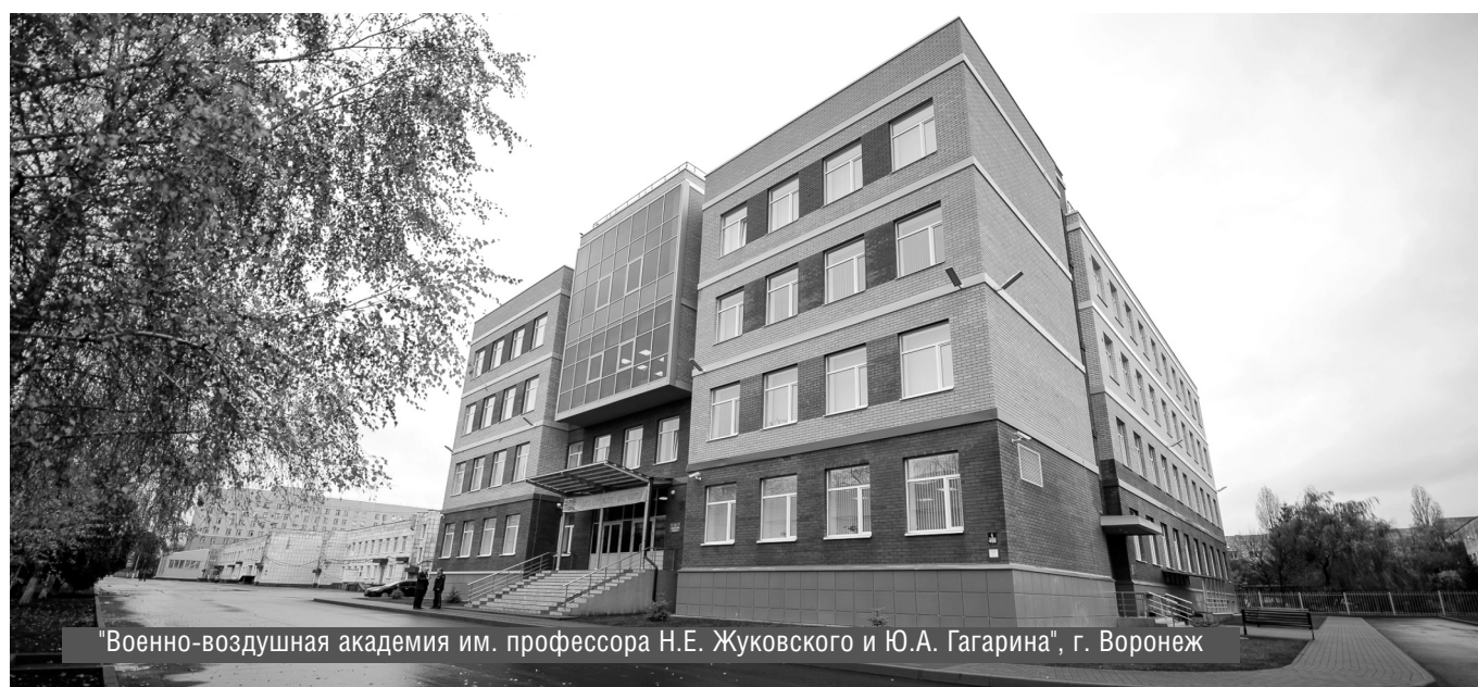
"Военно-воздушная академия им. профессора Н.Е. Жуковского и Ю.А. Гагарина", г. Воронеж

© С.В. Голубев, А.В. Могилев, В.В. Толстых, ( golsv24@mail.ru ), Журнал «Современная наука: актуальные проблемы теории и практики»,