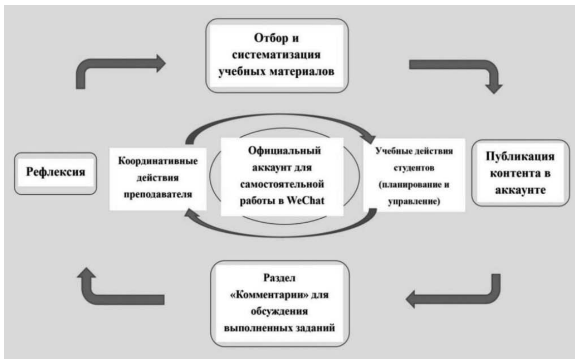
Рис.2. Модель организации самостоятельной работы студентов-нефилологов при изучении русского языка с использованием Интернет-ресурсов (Чжан Чжунлинь, Чжан Цзиньчжун, 2018)