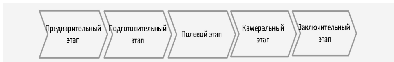
Рисунок 2. Этапы производства инженерных изысканий.

изыскательских компаний. Данное обстоятельство позволяет экстраполировать методику учета по инженерно-геологическим работам на другие виды инженерных изысканий.