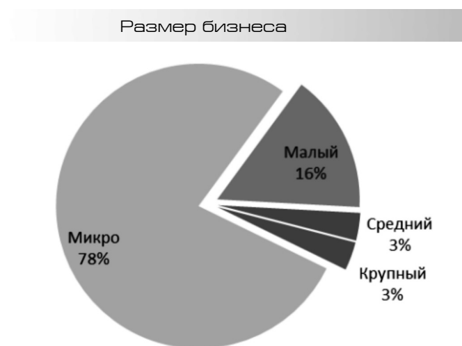
Рисунок 1. Структура изыскательской отрасли.

Однако, исследование структуры затрат показало, что зачастую изыскательские компании не предпринимают