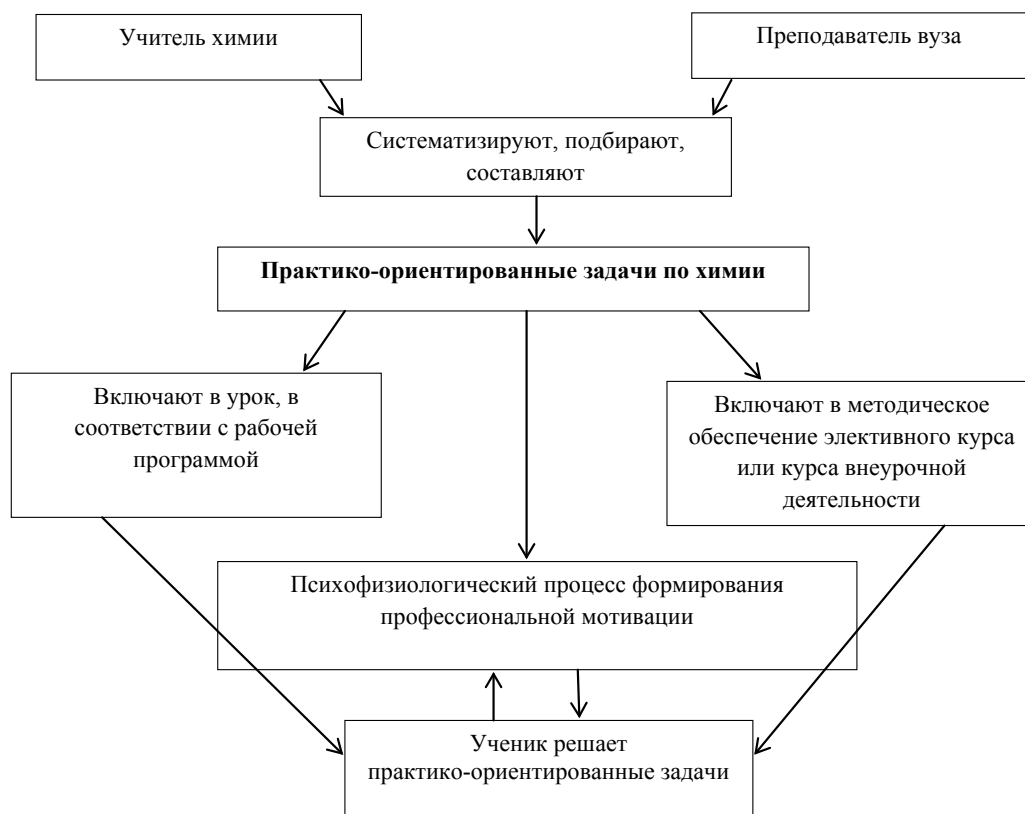
Рис. 1. Методическая система по использованию практико-ориентированных задач по химии в учебное и внеучебное время.