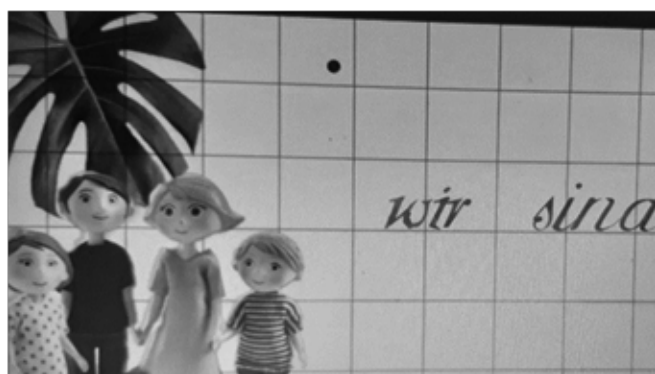
Рис. 3. Фрагмент ролика для заучивания спряжения глагола sein , созданный при помощи Film Maker Pro

Все изучаемые грамматические темы могут быть распределены между обучающимися для создания учебных роликов, что вовлечёт в процесс создания всех учащихся и создаст наглядную учебную базу.