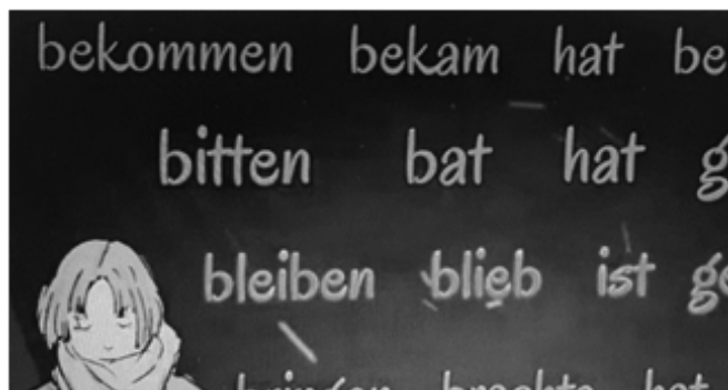
Рис. 2. Фрагмент ролика для заучивания 3 основных форм глагола , созданный при помощи Film Maker Pro

гократно просматривать его в течении дня на своих мобильных телефонах.