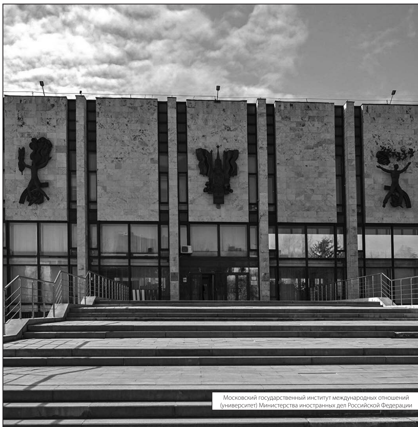
Московский государственный институт международных отношений (университет) Министерства иностранных дел Российской Федерации

Журнал «Современная наука: актуальные проблемы теории и практики»