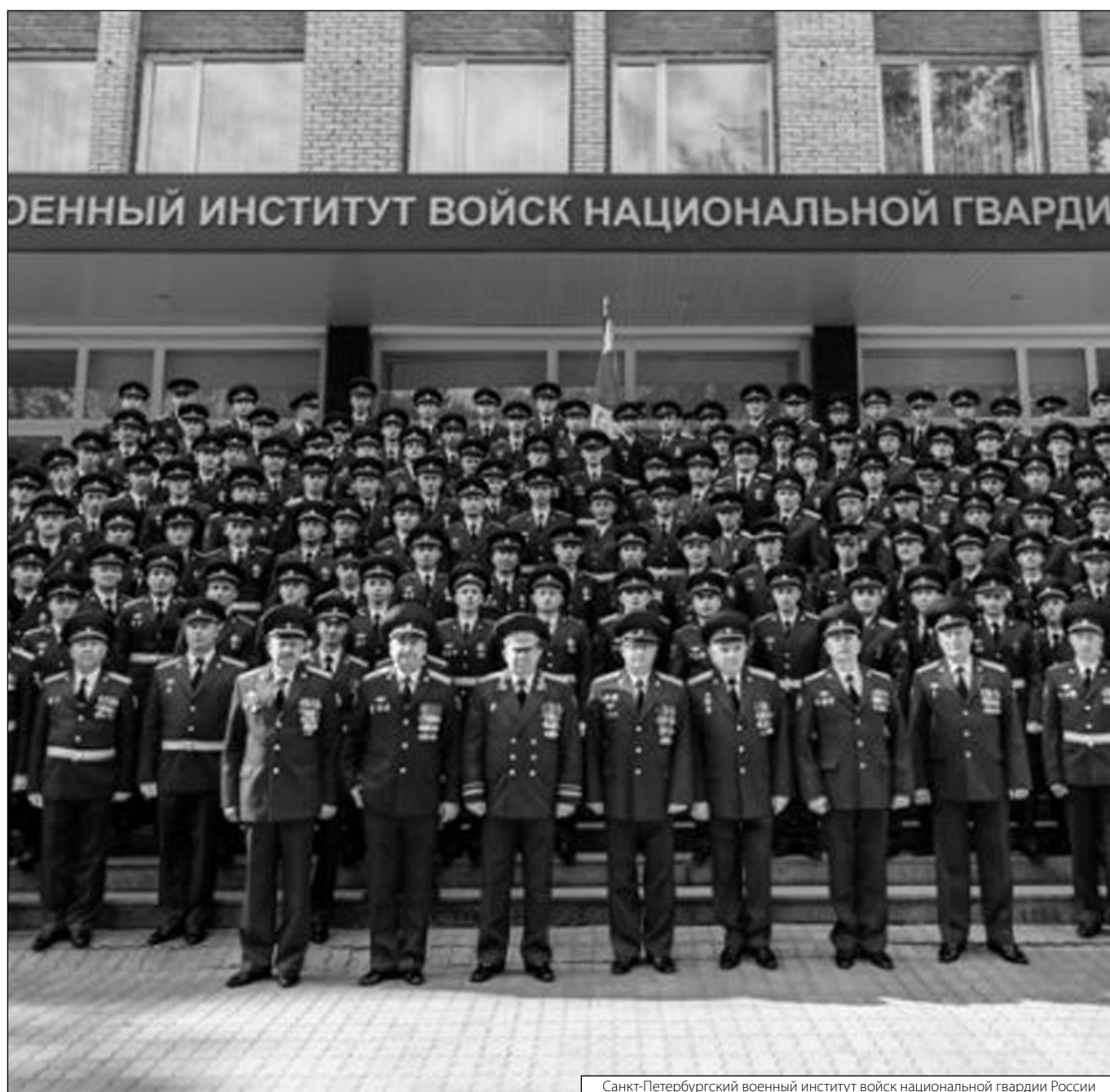
Санкт-Петербургский военный институт войск национальной гвардии России

Журнал «Современная наука: актуальные проблемы теории и практики»