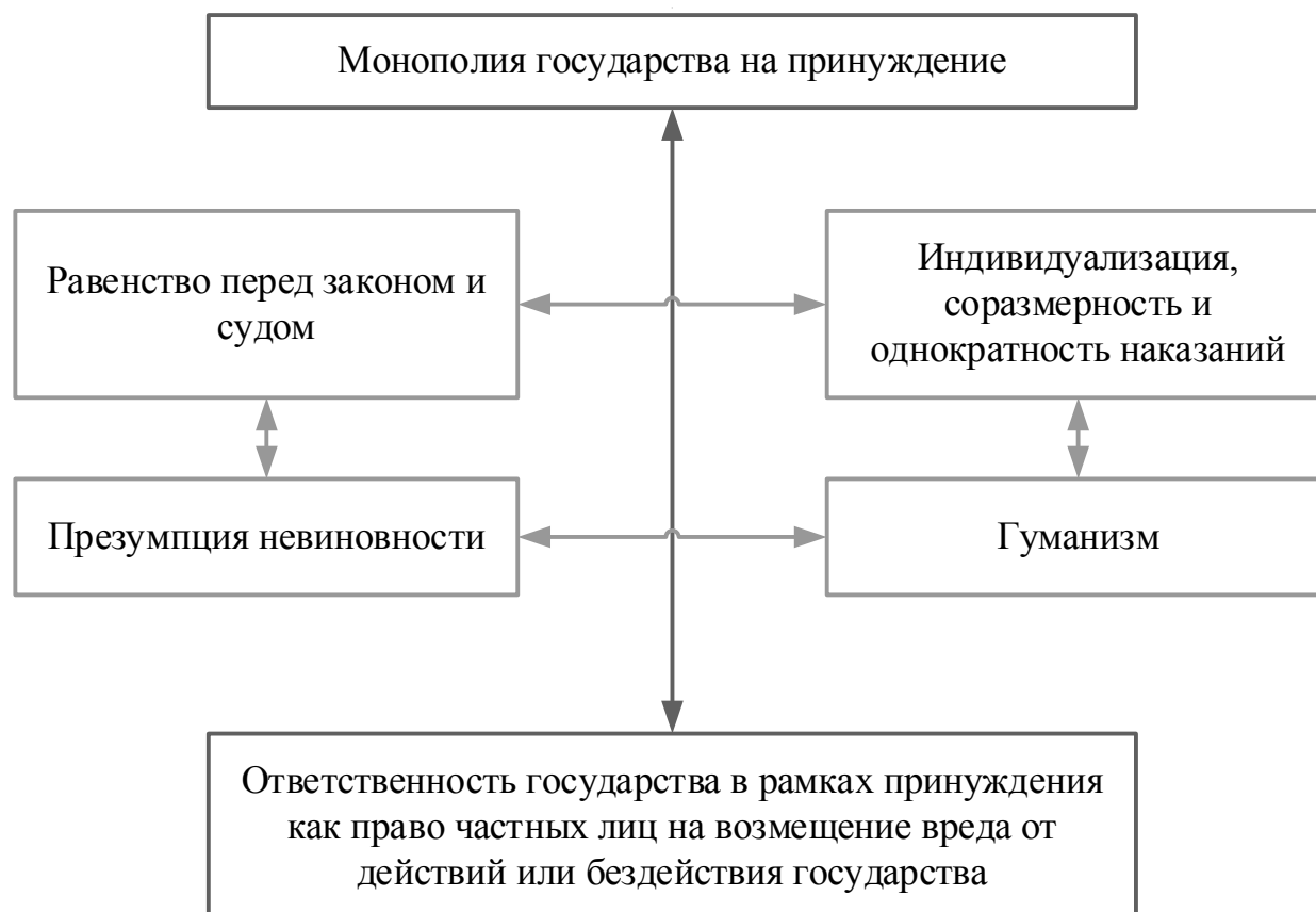
Рис. 2. Взаимосвязь принципов государственного принуждения между собой [сост. авт. согл. 2; 6; 9; 10; 11; 12]

духовно-нравственных ценностей, имморализации человека или группы лиц. Как описывает автор, процесс имморализации происходит, как возвеличивание «правильной» ценности при уничтожении ценности «неправильной». Возникает и реализуется правопритязание на установление норм морали, причем, данное явление в современном мире, переоценивающим традиционные ценности, становится все более тотально, как пишет в своем исследовании Е. Д. Гончаров.[5, с. 286–287]