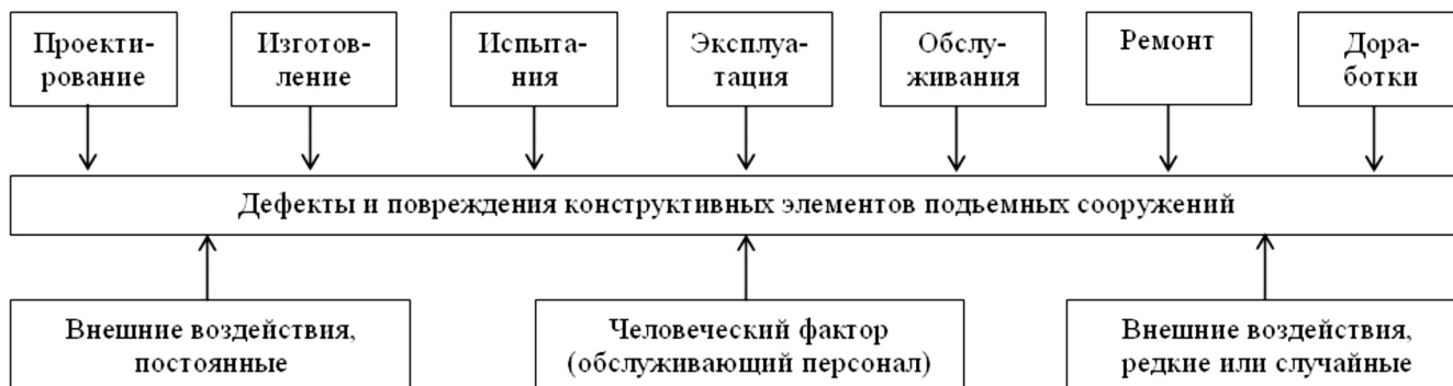
Рисунок 1. Структура групп факторов, которые приводят к накоплению дефектов и повреждений элементов подъемного сооружения.

P_t – показатель вероятности наступления физического износа подъемного сооружения (доля от единицы);