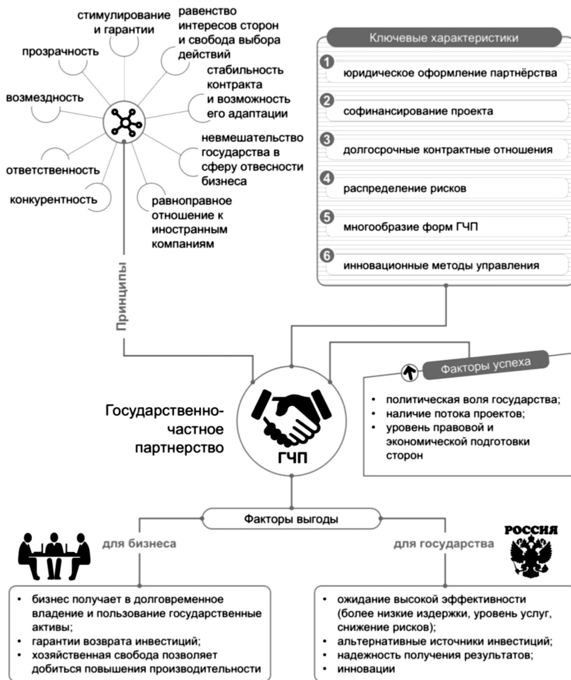
Рисунок 1. Основные принципы, ключевые характеристики, факторы успеха и выгоды государственно-частного партнёрства

Далее рассмотрим ключевые характеристики государственно-частного партнёрства. К ним относятся: юридическое оформление партнёрства между государством и частными компаниями посредством заключения специального соглашения; софинансирование проекта (частичная или полная оплата проекта за счёт бизнеса); отношения носят, как правило, долгосрочный характер; распределение рисков между сторонами соглашения;