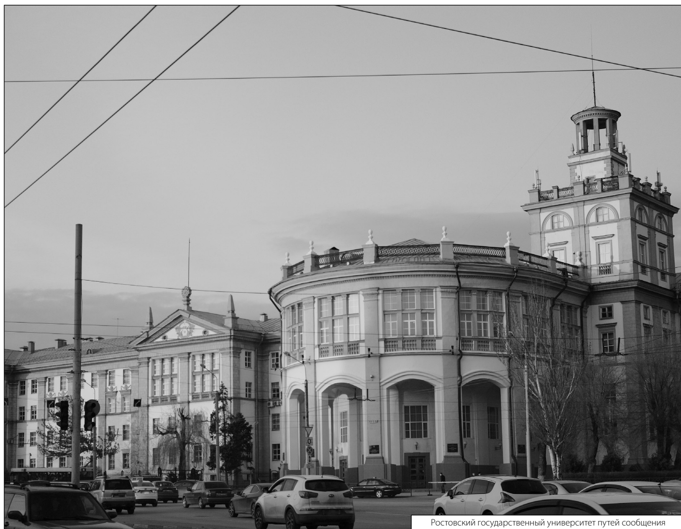
Ростовский государственный университет путей сообщения

Журнал «Современная наука: актуальные проблемы теории и практики»