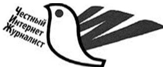
Рис. 3. ЧИЖ — логотип Хартии сетевых изданий Башкортостана

живаются ограничений, а это приводит к негативным последствиям, которые перекрывают положительные моменты.