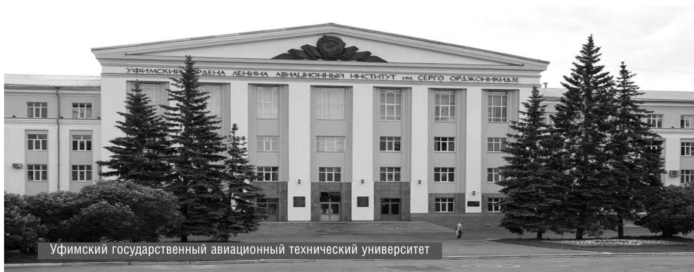
Уфимский государственный авиационный технический университет

© Е.А. Макарова, Э.Р. Габдуллина, Е.Ш. Закиева, ( makarova-ea@mail.ru ), Журнал «Современная наука: актуальные проблемы теории и практики».