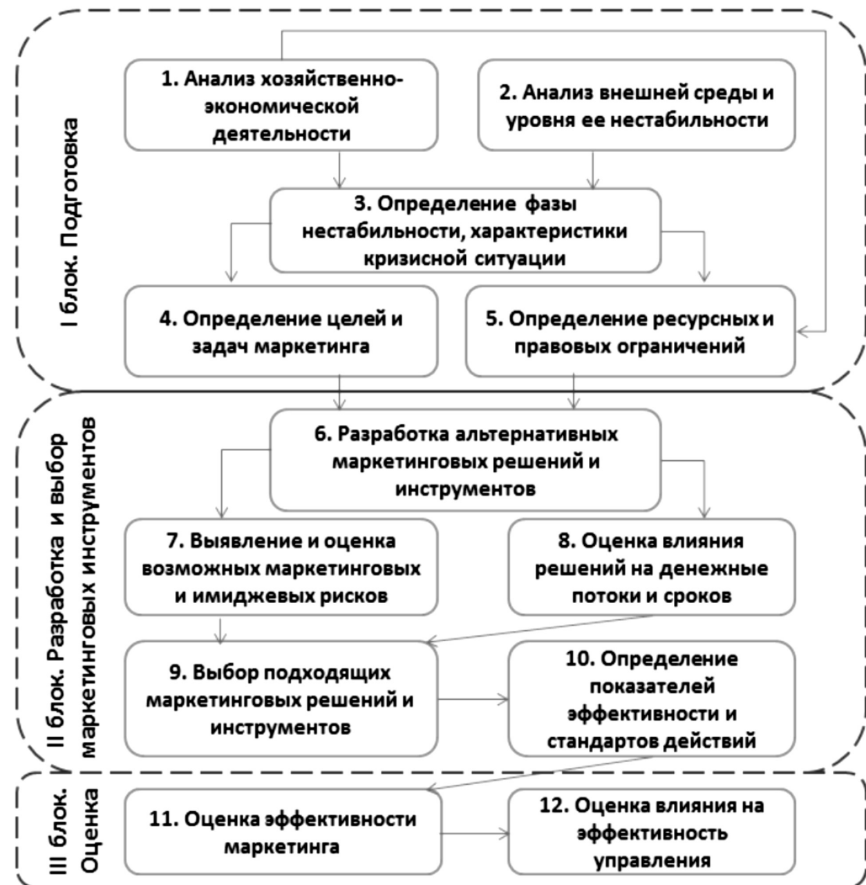
Рисунок 2. Алгоритм совершения последовательных маркетинговых действий на стадиях антикризисного или арбитражного управления.

ний, разделенные на три укрупненных блока: подготовка информации и утверждение целей, разработка и выбор маркетинговых решений и инструментов по их реализации и оценка выбранных инструментов с точки зрения эффективности их реализации, а также их влияния на общую эффективность управления нестабильными системами.