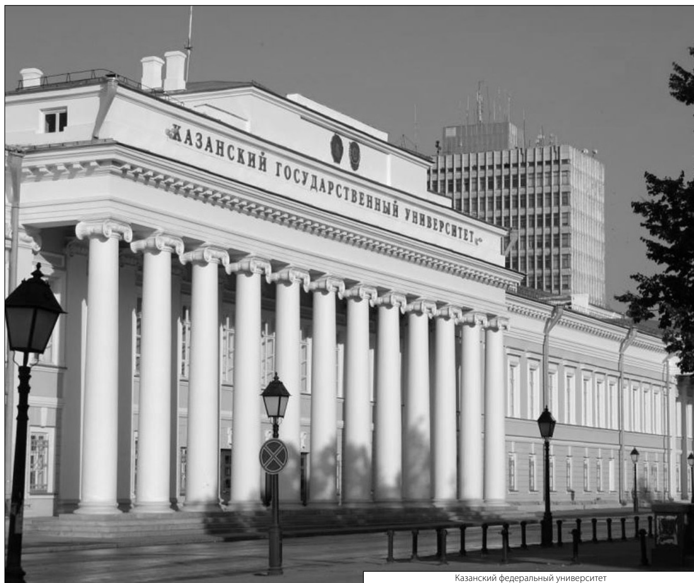
Казанский федеральный университет

© Галимова Алия Рафиковна ( aigel16@yandex.ru ), Житко Айгуль Корбановна ( aigel16@yandex.ru ), Житко Руслан Константинович ( aigel16@yandex.ru ), Хафизов Раис Габбасович ( aigel16@yandex.ru ). Журнал «Современная наука: актуальные проблемы теории и практики»