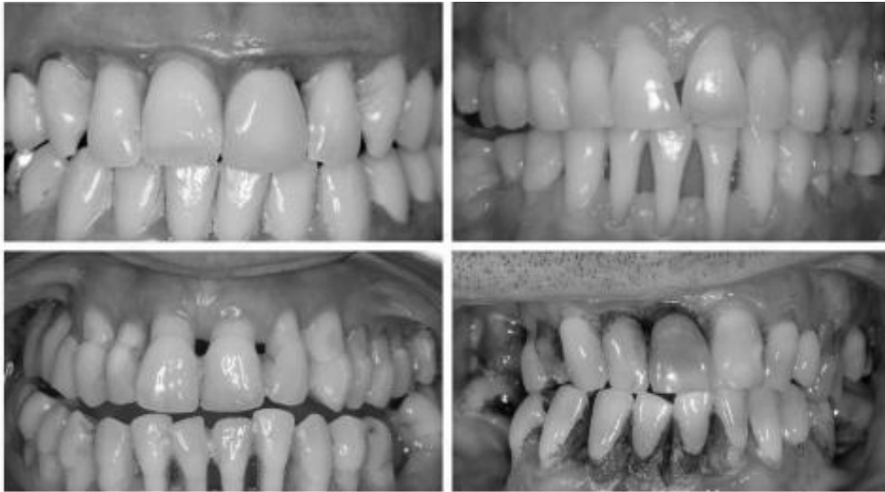
Рис. 1. Пациент 1–4 с различными стадиями генерализированного парадонтита