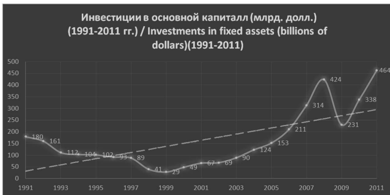
Рис. 3. Инвестиции в основной капитал РФ (млрд. долл.) (1991-2011 гг.) 7

В 1991-1998 гг. произошло обвальное сокращение показателей инвестирования в основной капитал (в 1998 г. его уровень составлял – 21,1% относительно данных 1990 г.). Существенное увеличение отмечалось специалистами сектора экономики в 1999-2008 гг., связывавшими указанные изменения с активным ростом стоимости нефти. В последующий 2007 г. инвестиционный рост достиг отметки - 23,8%. Кризис 2008-2009 гг. замедлил показатели и в последующие несколько лет положитель-