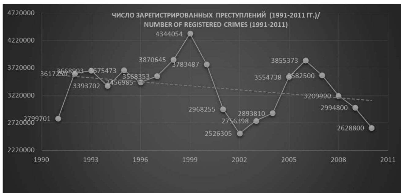
Рис. 1. Число зарегистрированных преступлений в РФ (1991-2011 гг.) 2