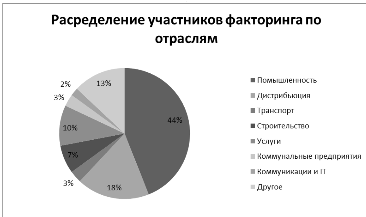
Рис. 2. Распределение участников факторинга по отраслям

Высокий уровень концентрации, демонстрируемый рынком факторинга ЕС, остается более или менее неизменным, при этом на пять ведущих стран приходится 72,5% от общего объема европейского рынка ЕС: Франция (18,2%), Великобритания (16,4%), Германия (15%), Италия (12,9%) и Испания (10%) [1].