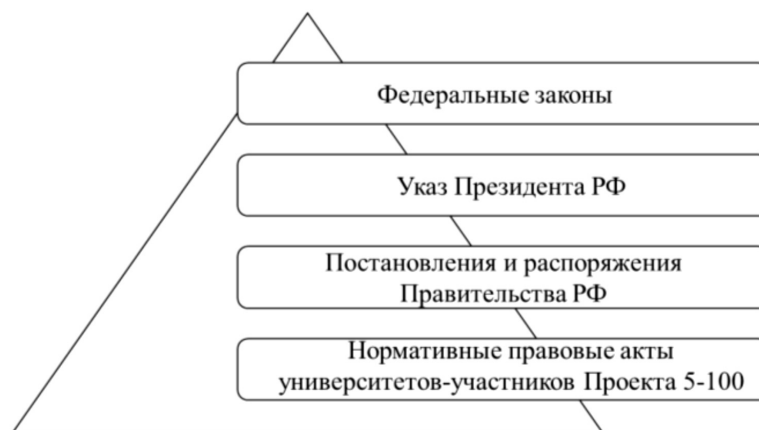
Рисунок 3. Иерархическая структура нормативных правовых актов Проекта 5-100.

ведения дополнительной декомпозиции процессов на любом уровне иерархии. При этом в нашем случае имеется возможно выявление несоответствий, а значит, и выявления необходимости создания новых нормативных правовых актов, но уже более низкого иерархического уровня. Результатом использования предложенного процессного метода правового обеспечения деятельности Проекта 5–100 должен стать прочный юридический базис всех мероприятий, проводимых в рамках повышения мировой конкурентоспособности российских университетов среди ведущих мировых научно-образовательных центров, построенный на основе иерархической структуры, представленной на рис. 3 .