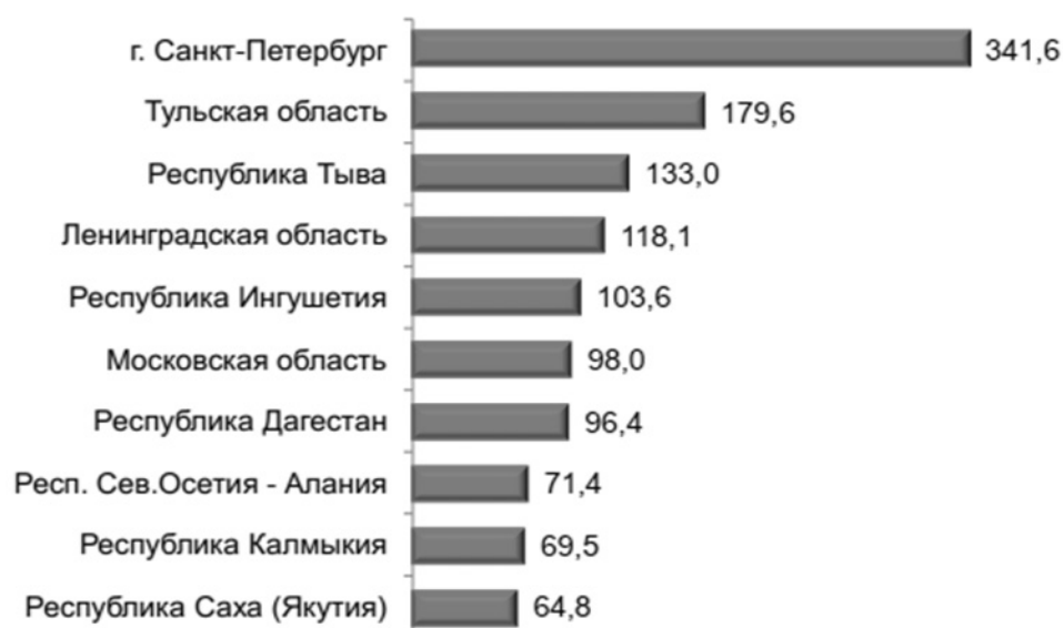
Рис. 2. Регионы с наибольшими темпами прироста зарегистрированных преступлений, совершенные с использованием информационно телекоммуникационных технологий или в сфере компьютерной информации [8].

По мнению А.И. Плотникова «уголовная ответственность — это принудительная мера уголовно-правового воздействия, применяемая государством к совершившему преступление лицу и выражающаяся в ограничении его правового статуса» [5]. Данному виду юридической ответственности присущи все те же признаки и принципы, что и другим видам юридической ответственности. Отличается лишь цель. В соответствие со статьей 44 УК РФ к таким целям относятся: