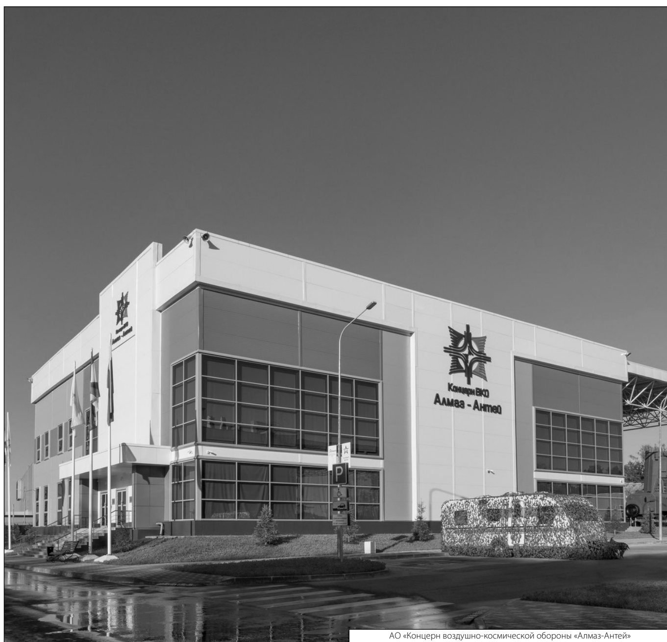
АО «Концерн воздушно-космической обороны «Алмаз-Антей»

Журнал «Современная наука: актуальные проблемы теории и практики»