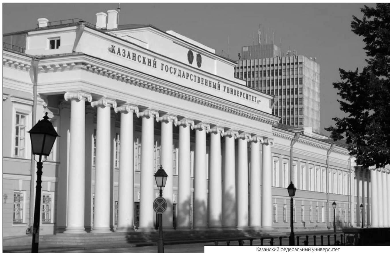
Казанский федеральный университет

Журнал «Современная наука: актуальные проблемы теории и практики»