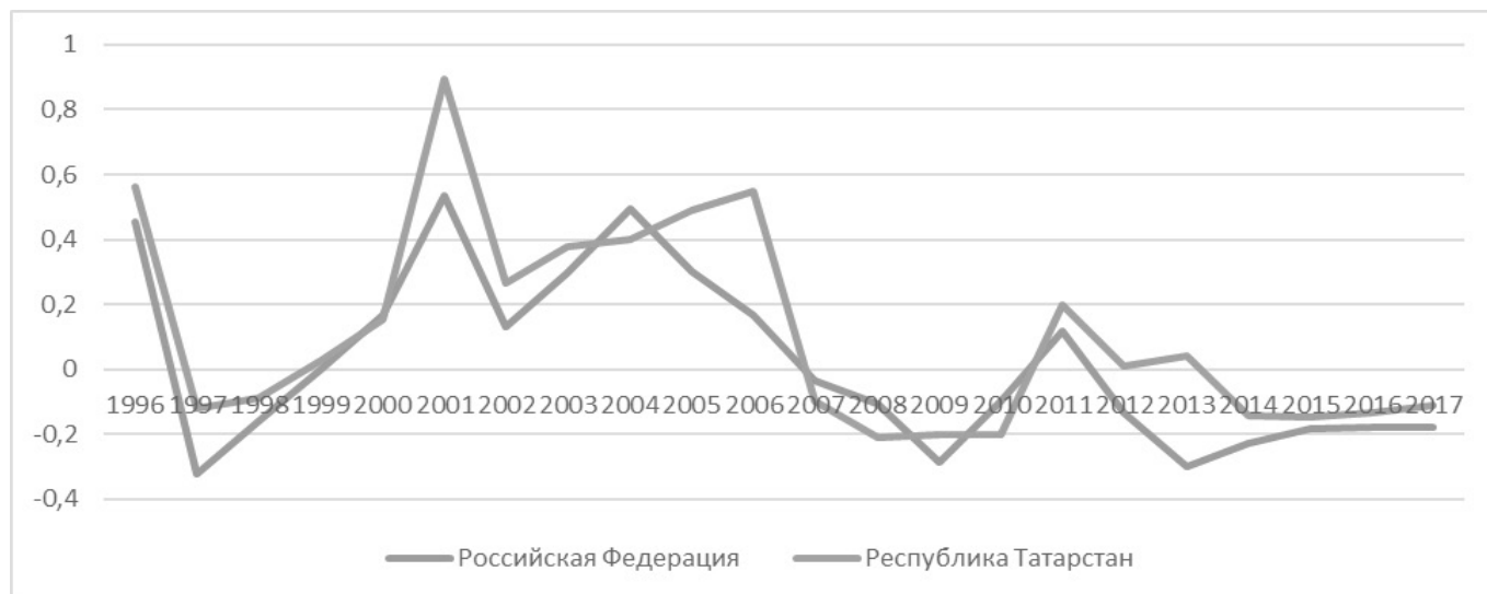
Рис. 2. Интегральные значения сводных индексов опережающего развития Российской Федерации и Республики Татарстан (формализованные оценки ожиданий экономических агентов макро- и мезоуровня)

в будущем, то опираясь на них можно количественно выразить ожидания хозяйствующих субъектов по поводу оцениваемых ими в текущий момент времени будущих преобразований и трансформаций.