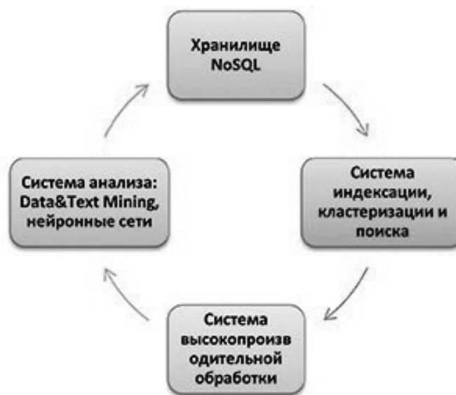
Рис. 2. Взаимодействие элементов Big Data

В задаче выявления перспективных направлений технология текстового майнинга предоставляет возможность поиска литературных источников по заданной территории и заданной теме, поиска схожих проектов и геологических результатов, схожих идей для разведки и т.д. примером таких инструментов является RapidMiner ( http://rapidminer.com/ ) или HP IDOL. Благодаря этой технологии для анализа становятся доступны значительно большие объемы источников данных, а глубина