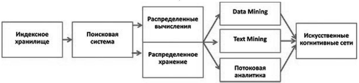
Рис. 3. Пример последовательности внедрения технологии Big Data для решения задач ГРП