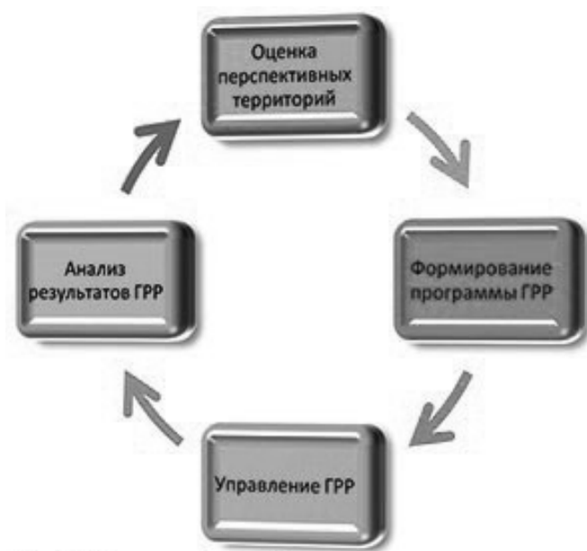
Рис. 1. Жизненный цикл бизнес-процесса воспроизводства минерально-сырьевой базы (ВМСБ)

В предыдущие годы это решалось путем создания хранилища в реляционной базе данных для цифровых структурированных данных, неструктурированные данные размещались в файловых каталогах. СУБД имеет один существенный недостаток-жесткую привязку структуры хранения к структуре исходных данных. Из-за высокой неопределенности поиска данных использование SQL-запросов к жестко структурированной базе данных неэффективно.