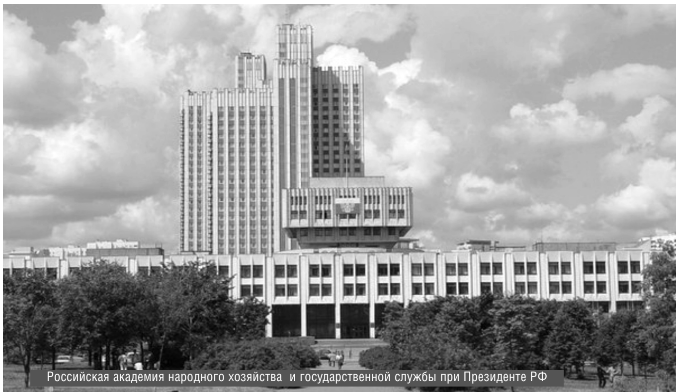
Российская академия народного хозяйства и государственной службы при Президенте РФ

© С.А. Головин, ( golovin_sa@list.ru ), Журнал «Современная наука: актуальные проблемы теории и практики»,